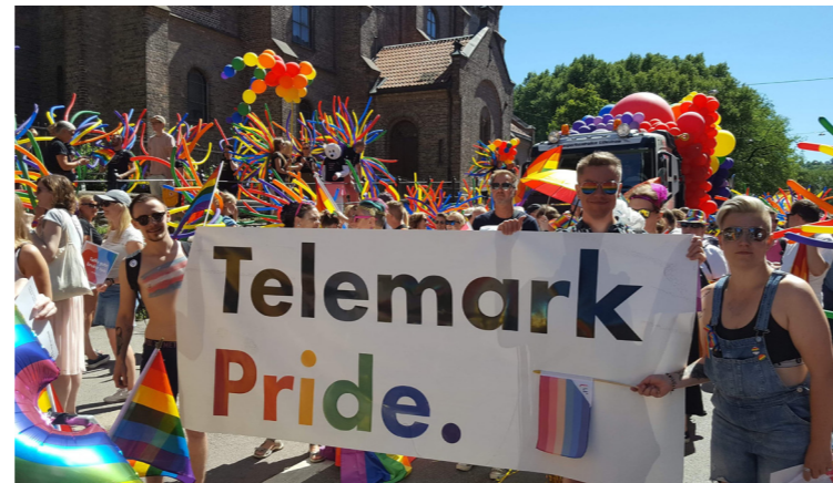
Telemark Pride på besøk i Oslo

Stavanger på Skeivå kunne i år markere sitt