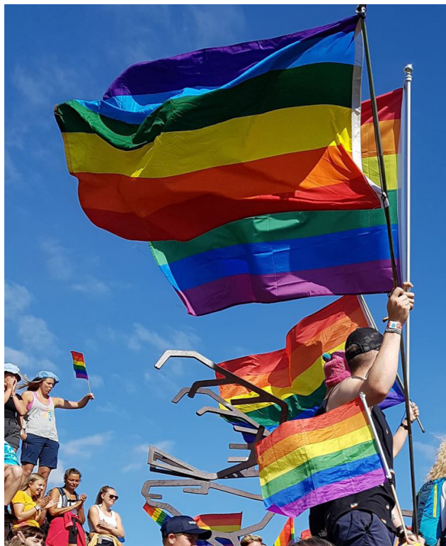
Vinjepride 2018, FRI Innlandet

2018 har vært et formidabelt år for lokal aktivitet i organisasjonen. Nye aktivitetsgrupper og arrangementer flere steder i landet gjør at vi når ut til enda flere, og kan skape trygge og gode møteplasser for nye målgrupper. 2018 har også vært året for mange helt nye Pride-festivaler mange nye steder.