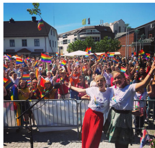
Historiens første Pride Innlandet i Brumunddal!