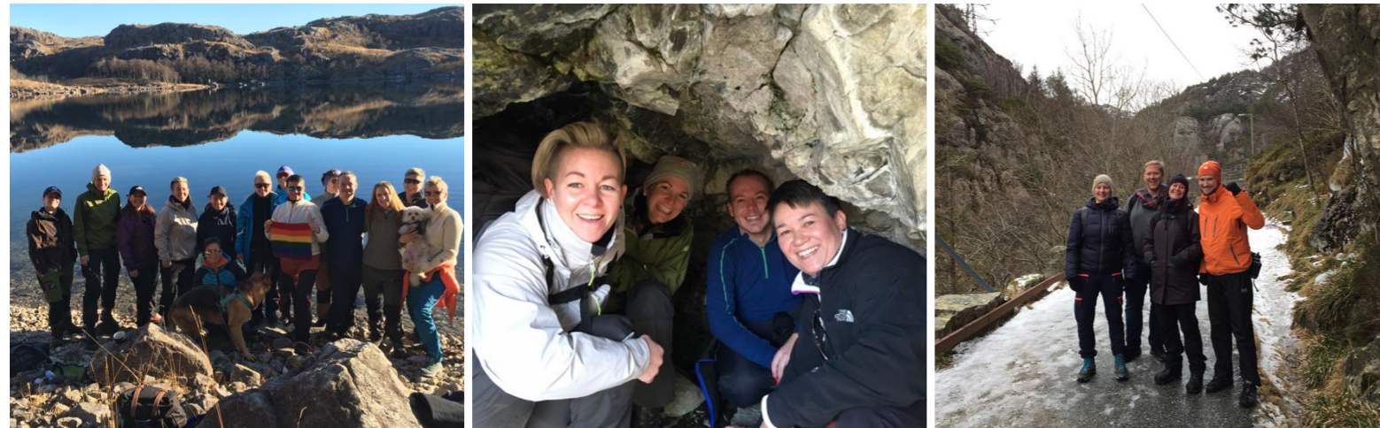
Tur- og friluftsgupper er populære medlemstilbud over hele landet! Her to bilder fra den nyoppstartede gruppa i Rogaland (t.v) og et fra godt etablerte FRI.luft i Bergen