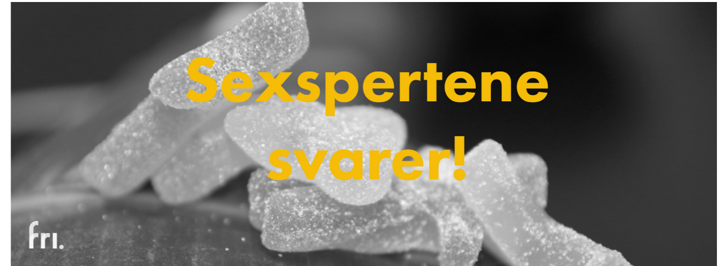
Arrangementsbilde Skeiv debatt 4, 2018