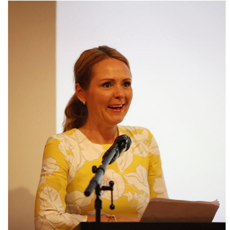
Barne- og likestillingsministeren åpnet FRI sitt landsmøte