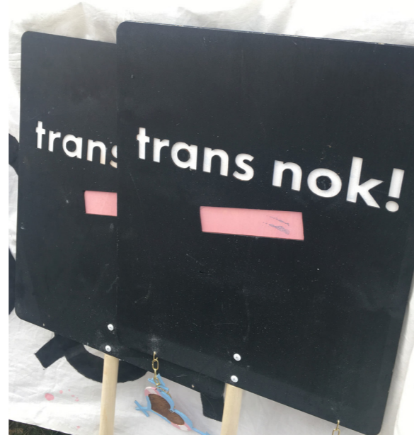
Materiell fra aksjon i Oslo og Bergen 18. april 2018