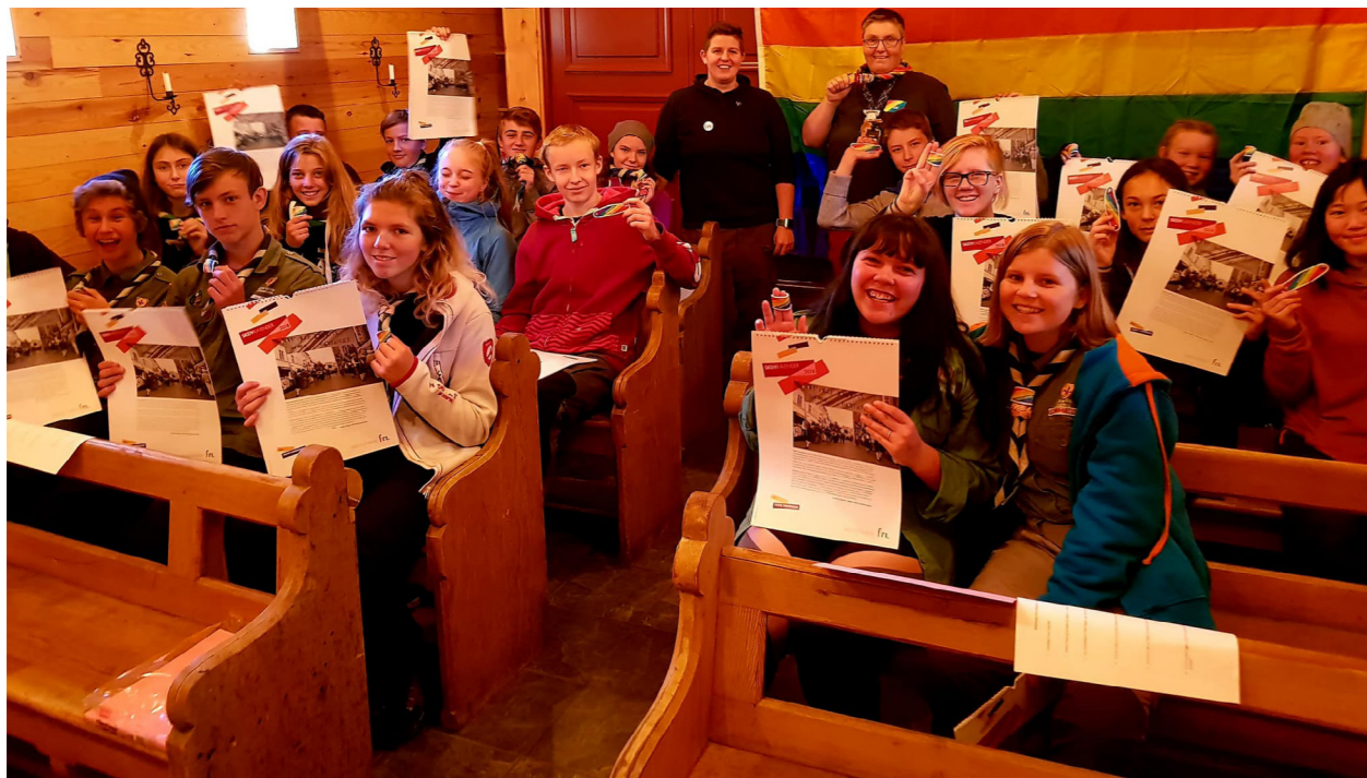
FRI innlandet på besøk hos KFUK/KFUM-speiderleir

Alt dette er kun en håndfull av de aktivitetene og tilbudene som finnes rundt om i landet. Aktivitetsnivået er så høyt og tilbudene som finnes er etter hvert blitt så mange, at det er umulig å gi alle plass i denne rapporten. Samtidig er det flere steder i landet som ønsker aktivitet der vi ikke har ressurser til å følge opp. Vi er glad for økt etterspørsel, men synes det er synd at vi ikke har mulighet til å følge opp lokale initiativ der det trengs aller mest. Derfor jobber vi med å få på plass ressurser til bedre organisatorisk oppfølging.