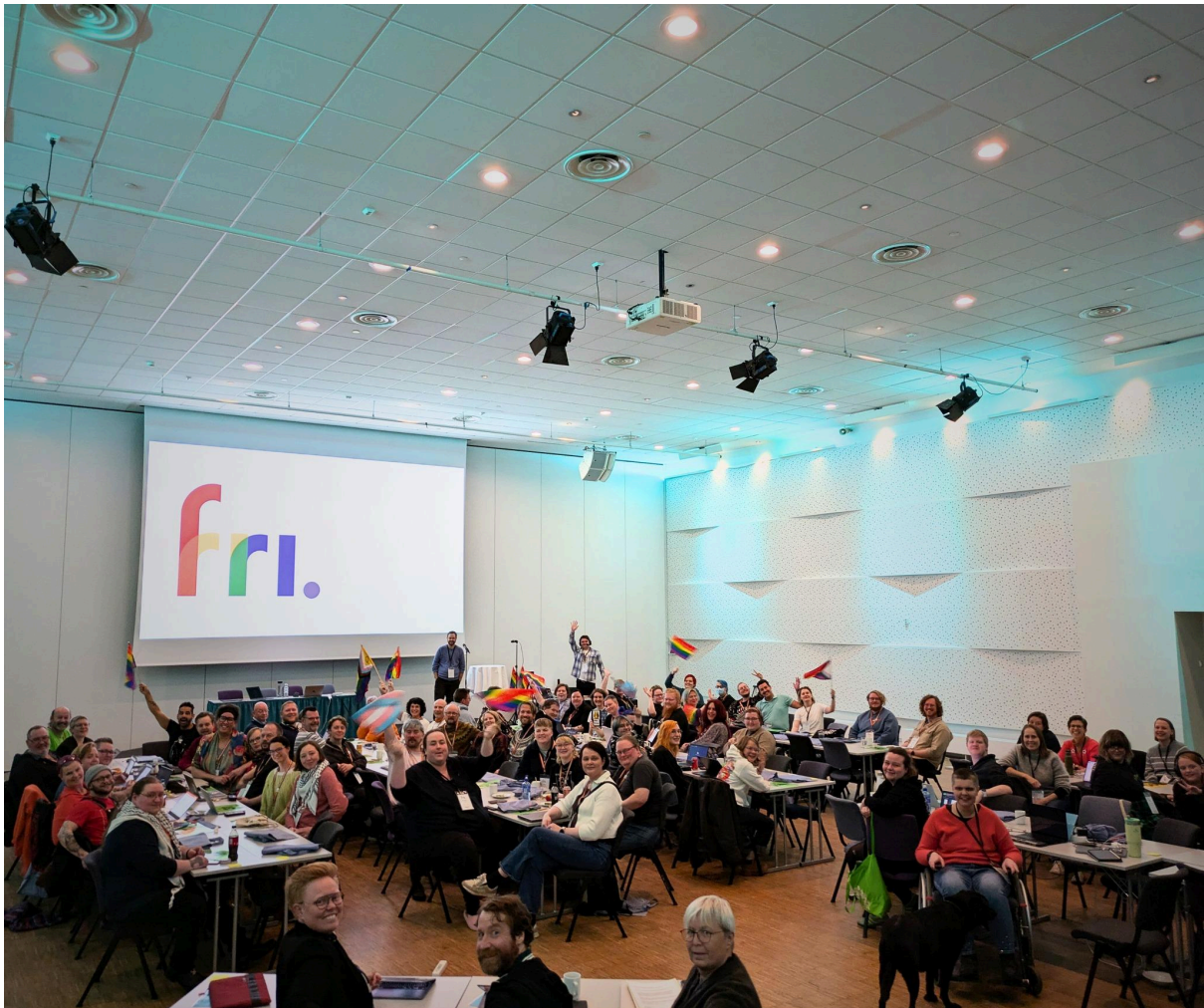
Bilde: Fra FRI's landsmøte 2024. Frivillige delegater fra FRI's fylkeslag samlet for å bestemme FRI's arbeidsprogram med mer.

FRI er en demokratisk medlemsorganisasjon som til enhver tid styres av medlemmene som bruker stemmeretten sin og engasjerer seg på ulike nivåer av organisasjonen. Gjennom fylkeslagenes årsmøter og medlemsmøter kan medlemmene bestemme aktivitetene og den politiske virksomheten i sitt fylkeslag, eller foreslå saker til landsstyret eller landsmøtet.