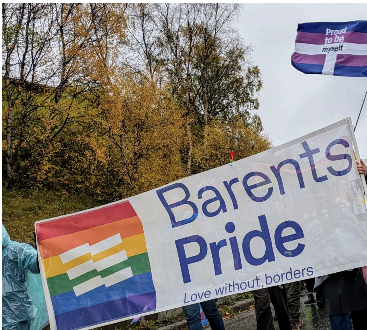
Bilde fra Barents Pride 2024 i Kirkenes.

Hatet mot skeive øker i Norge. Vi ser at skeive barn og unge mobbes mer og har mindre framtidstro enn majoriteten. Transpersoners eksistens diskuteres på alt fra Stortingets talerstol til den enkeltes facebook-vegg. Hatkriminalstatistikken øker og tilliten til politiet er lav.