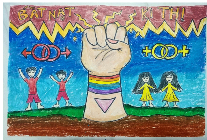
Tegning fra barneprosjektet i Nepal

I 2021 har FRI EØS-støttede partnersamarbeid med organisasjoner i Polen, Tsjekkia, Kroatia, Estland og Latvia. Samarbeidene spenner over mange tematiske områder som bekjempelse av hatkriminalitet, skeive med rom-bakgrunn, bekjempelse av mobbing i skolen, styrking av kompetanse innen psykisk helse, og hvordan drive lokalt og nasjonalt påvirkningsarbeid for å fremme rettighetene til lhbt-personer.