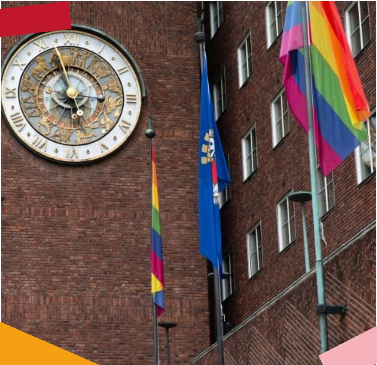
Regnbueflagget utenfor Oslo Rådhus.